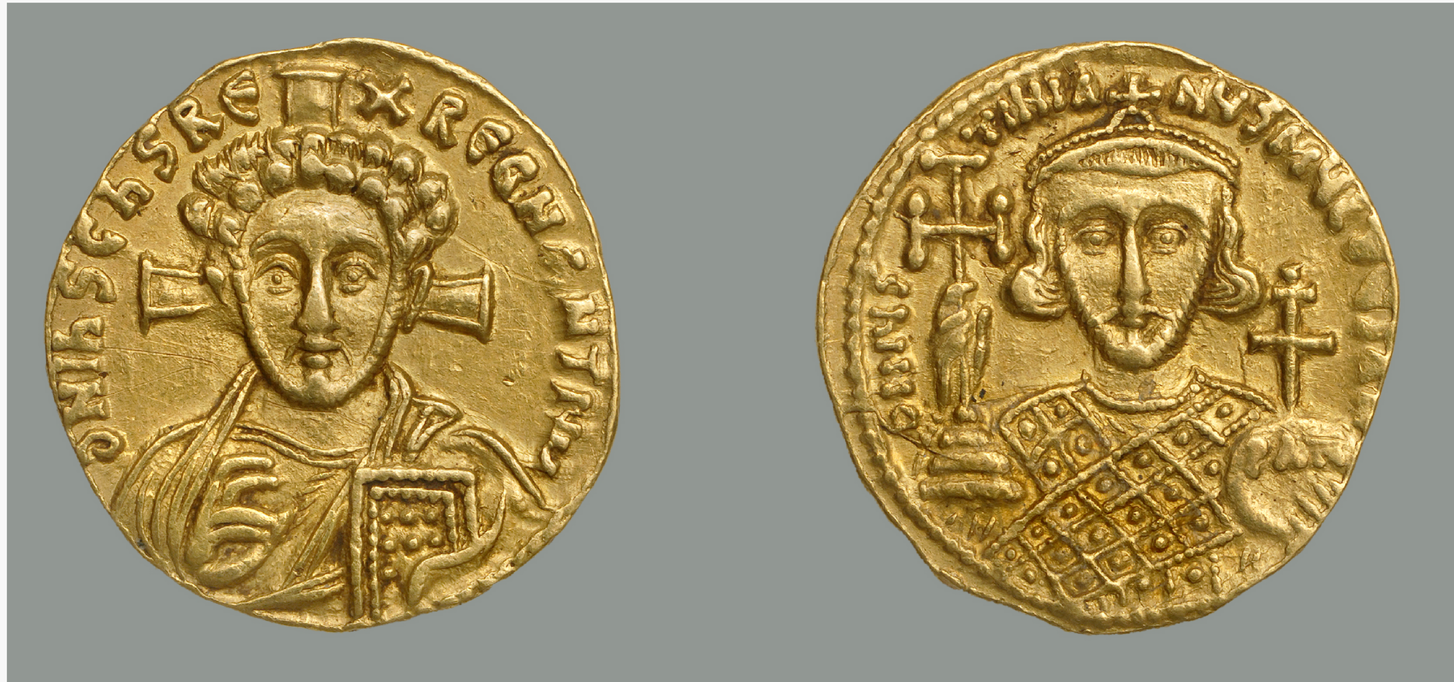
SOLIDUS DE JUSTINIEN II, 705, CONSTANTINOPE