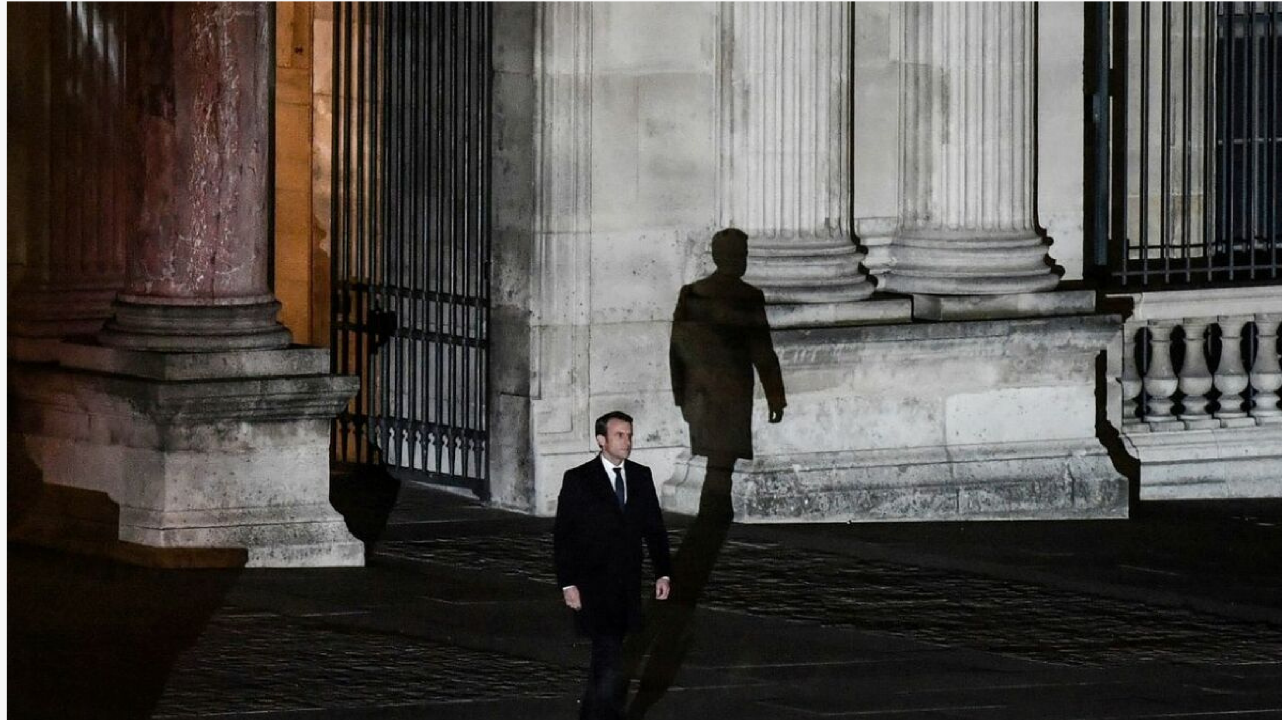
EMMANUEL MACRON AU SOIR DE SON ÉLECTION, LE 7 MAI 2017