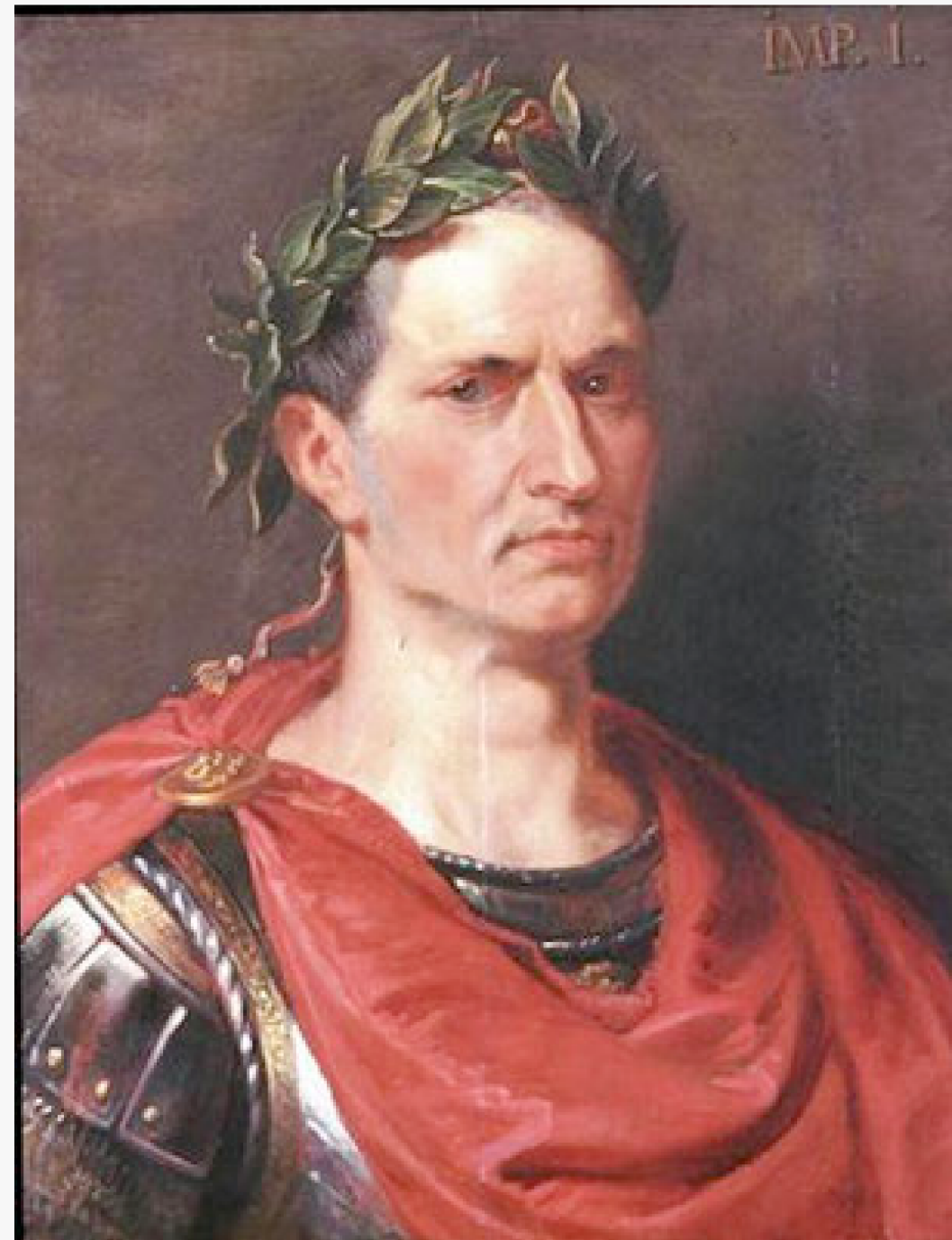
JULES CÉSAR, SUPERSTAR DU STORYTELLING, ATOUR DE -45 AVANT JC. (PETER PAUL RUBENS)