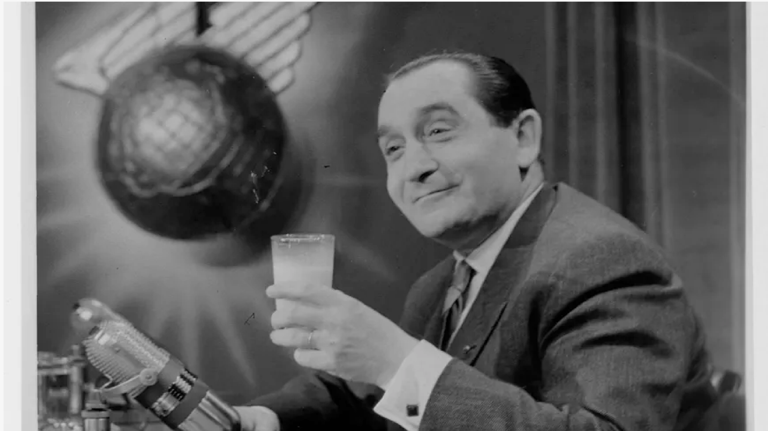
PIERRE MENDÈS-FRANCE, PRÉSIDENT DU CONSEIL DES MINISTRES, PROMeut LE LAIT DANS LES CANTINES SCOLAIRES EN 1954