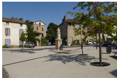
Les Cabannes