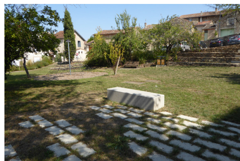
Castelnau de Levis