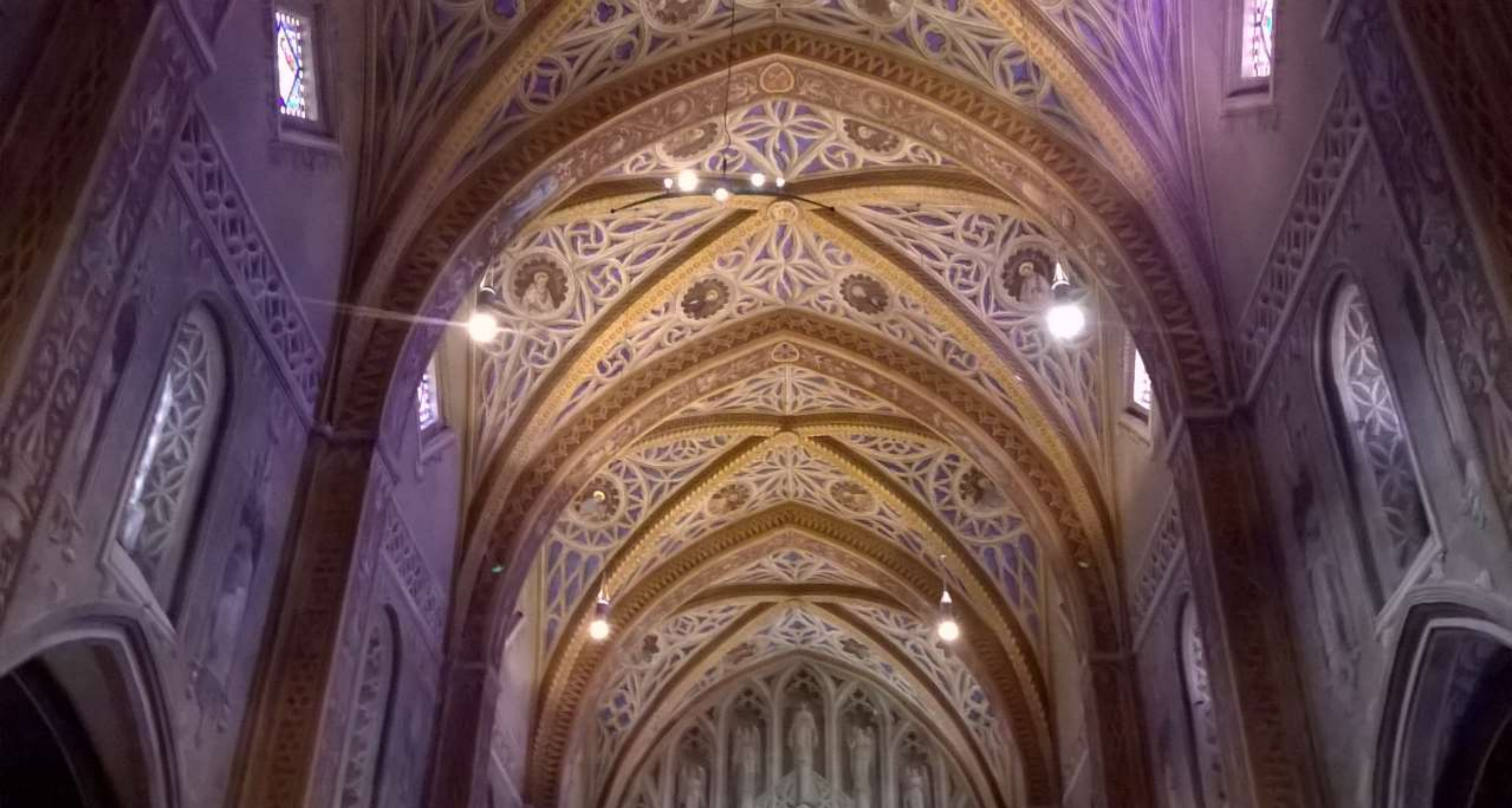
Souscription - Peintures murales de la cathédrale Saint Alain de LAVAUR - après travaux