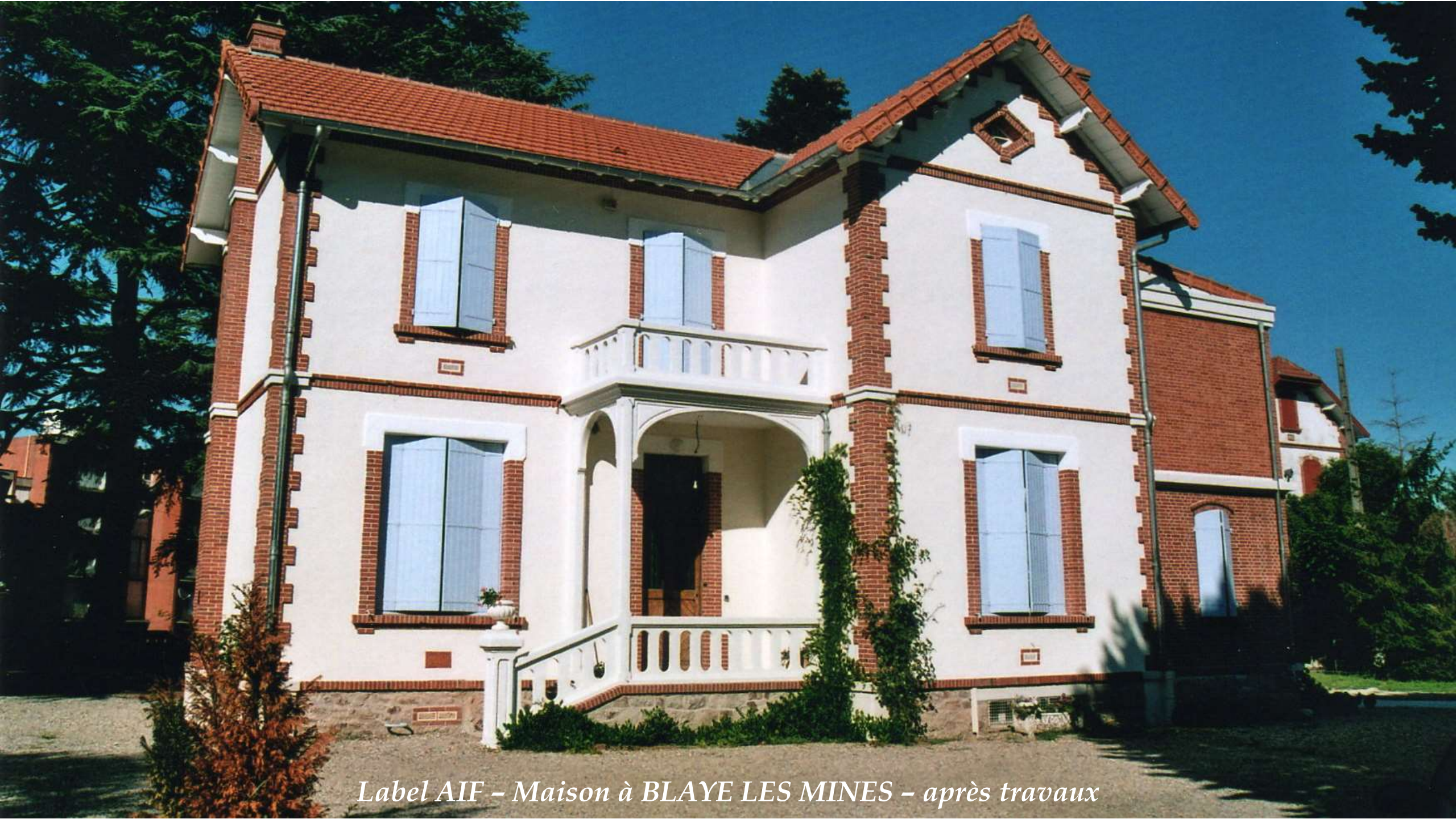
Label AIF - Maison à BLAYE LES MINES - après travaux