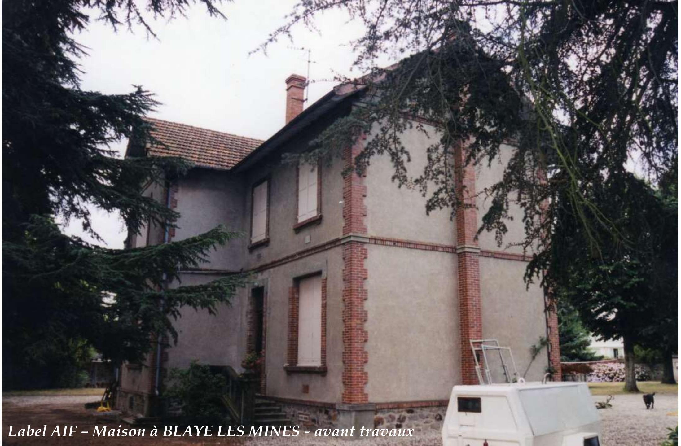
Label AIF - Maison à BLAYE LES MINES - avant travaux