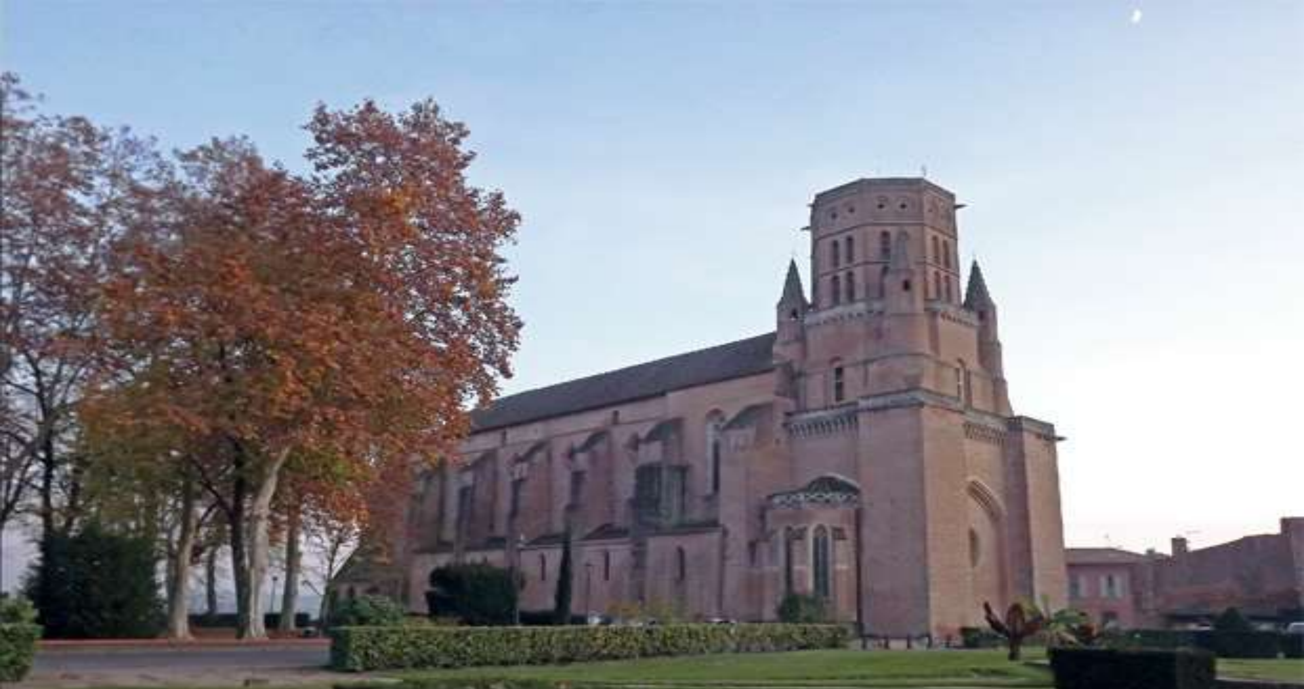
Cathédrale Saint Alain de LAVAUR – Souscription pour la restauration des décors peints intérieurs