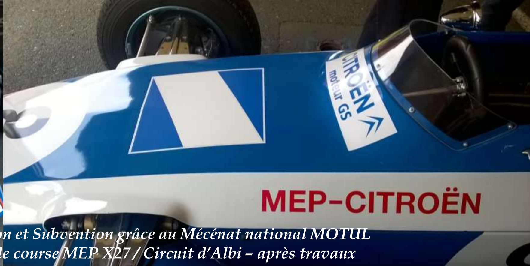
Souscription et Subvention grâce au Mécénat national MOTUL Voiture de course MEP X27 / Circuit d'Albi - après travaux