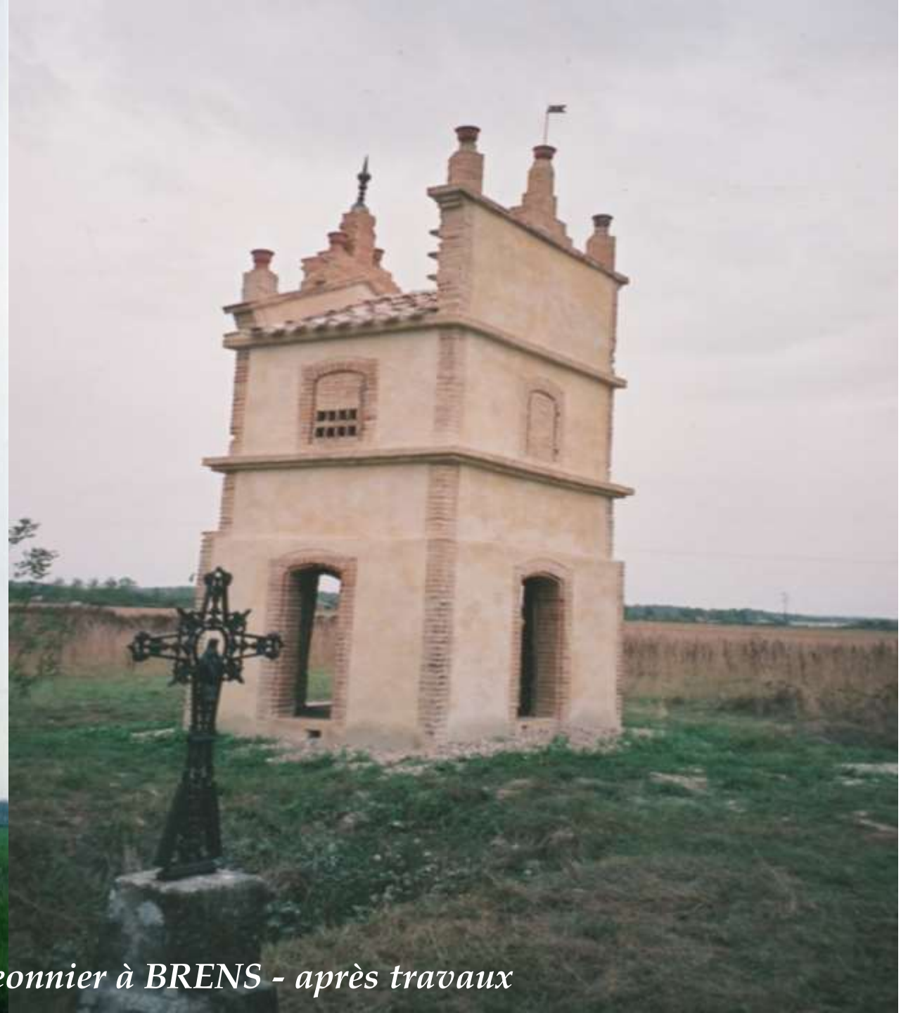
avant travaux - Label AIF : Pigeonnier à BRENS - après travaux