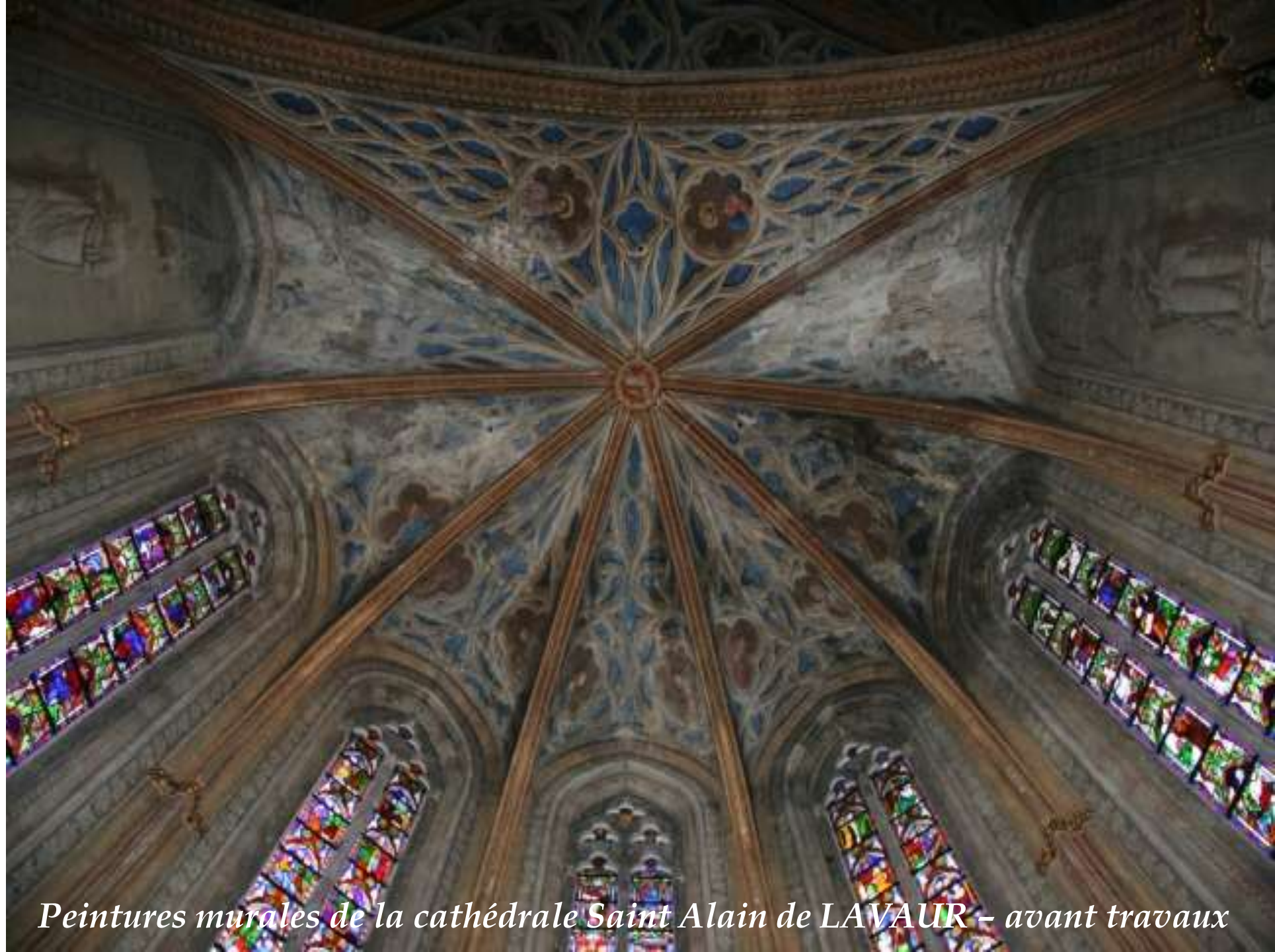
Peintures murales de la cathédrale Saint Alain de LAVAUUR - avant travaux