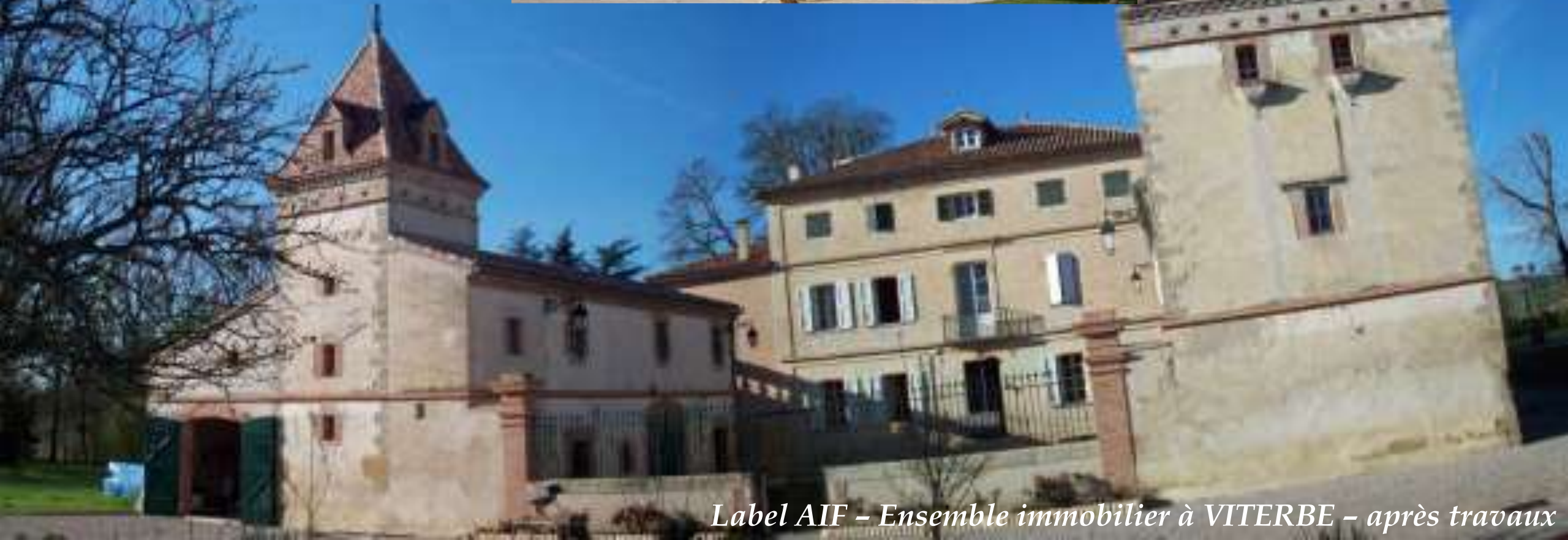
Label AIF - Ensemble immobilier à VITERBE - après travaux