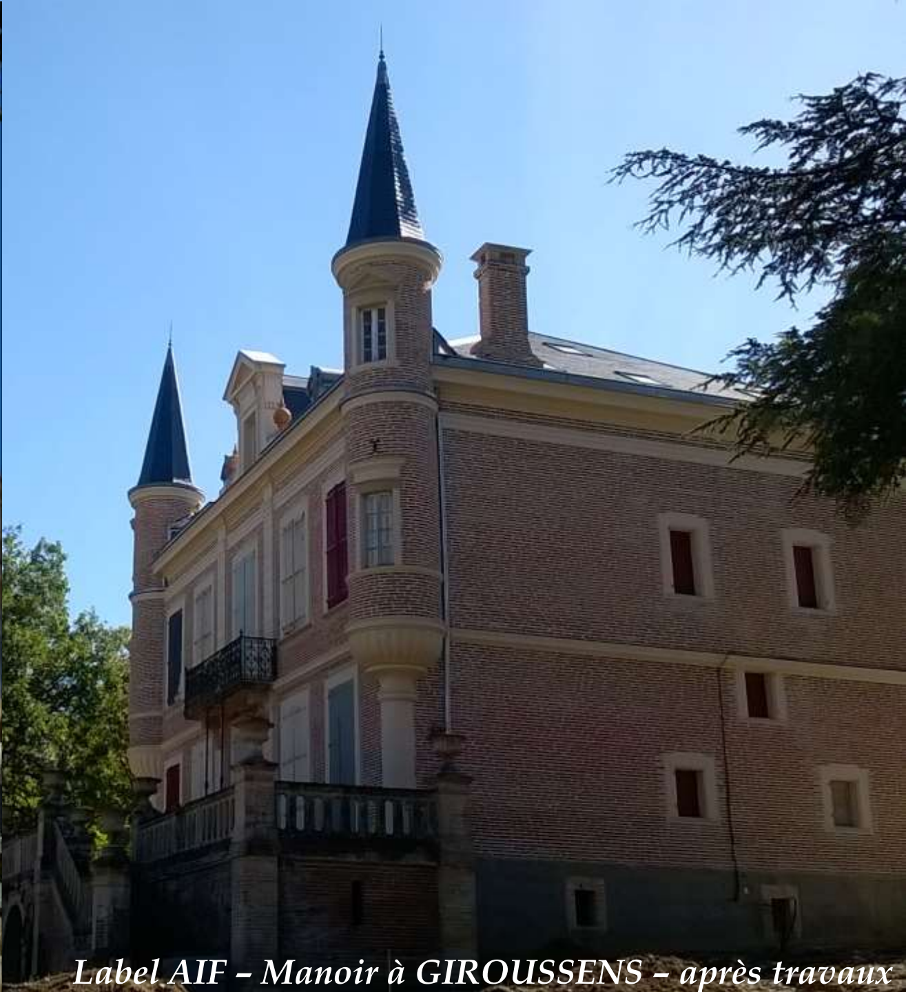
Label AIF - Manoir à GIROUSSENS - après travaux