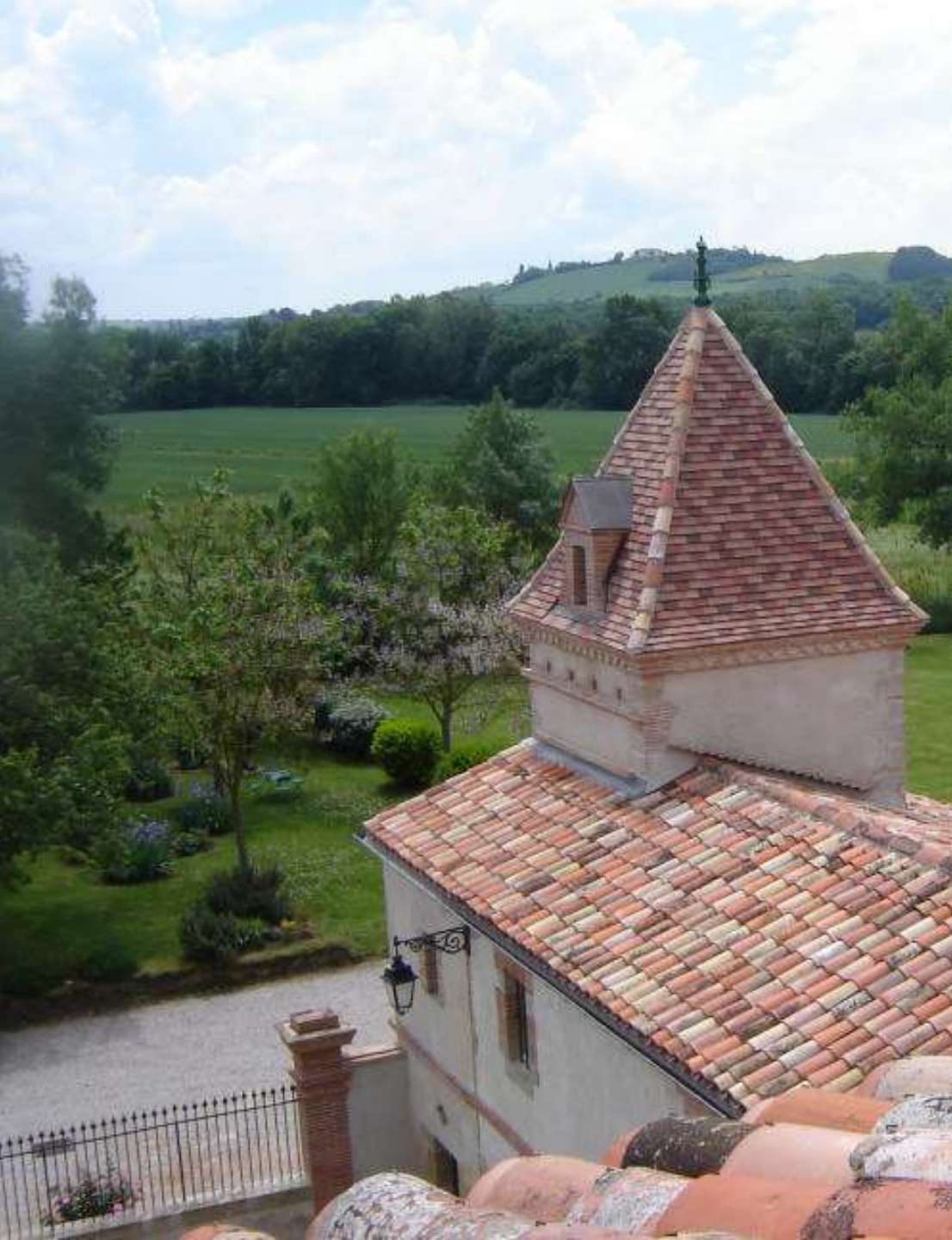
Label AIF - Ensemble immobilier à VITERBE - après travaux