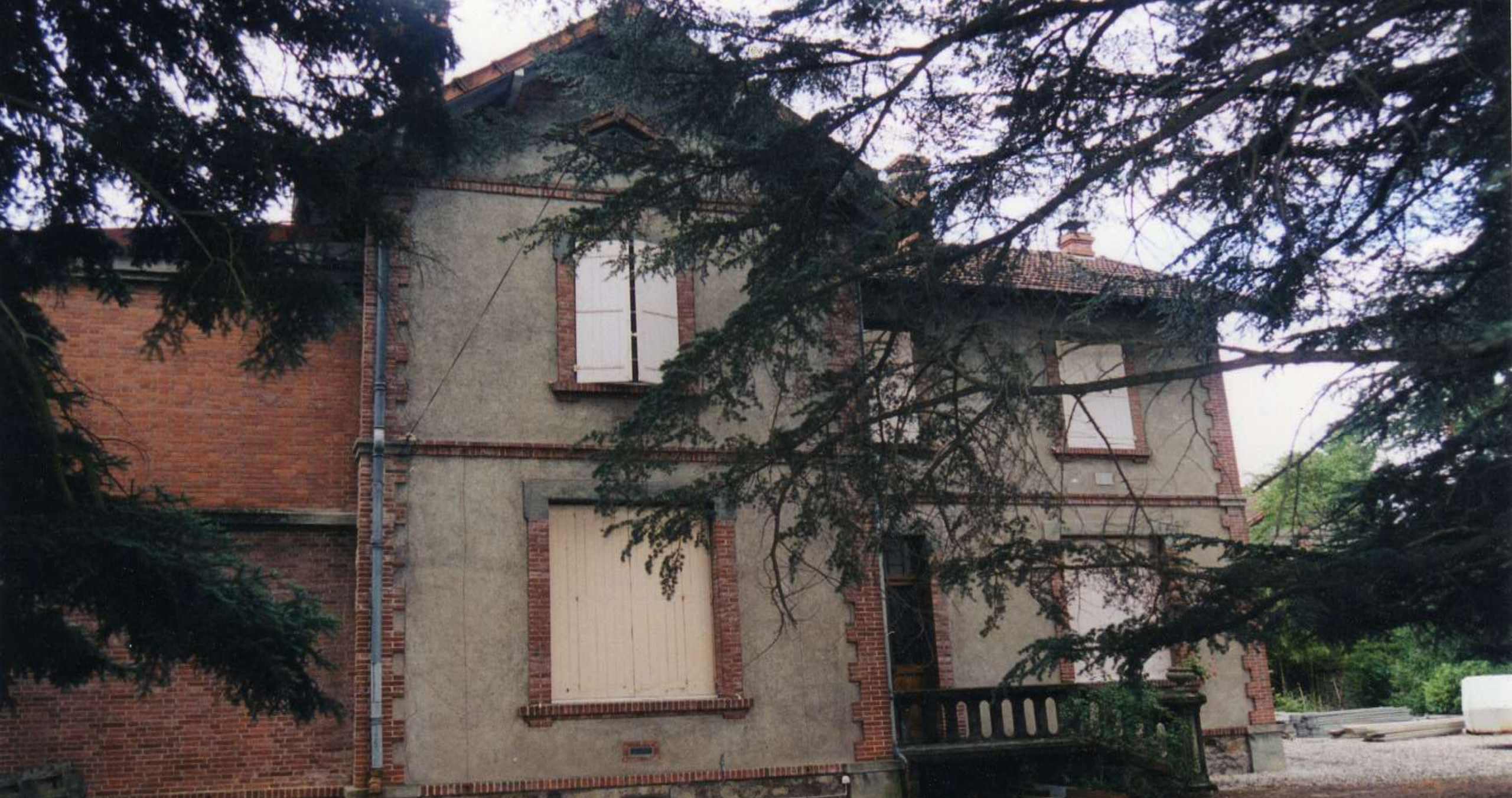
Label AIF - Maison à BLAYE LES MINES - avant travaux