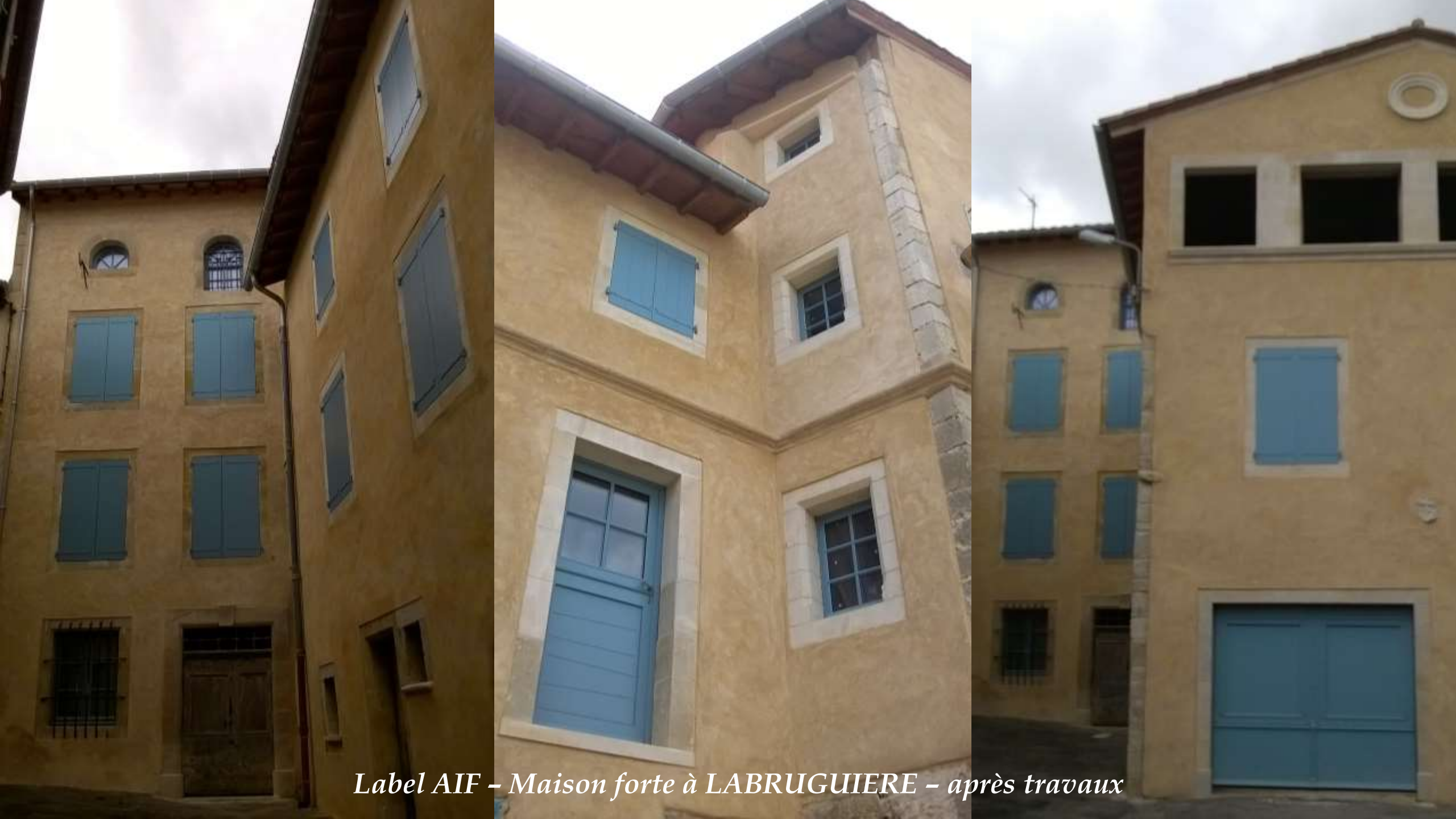
Label AIF – Maison forte à LABRUGUIERE – après travaux