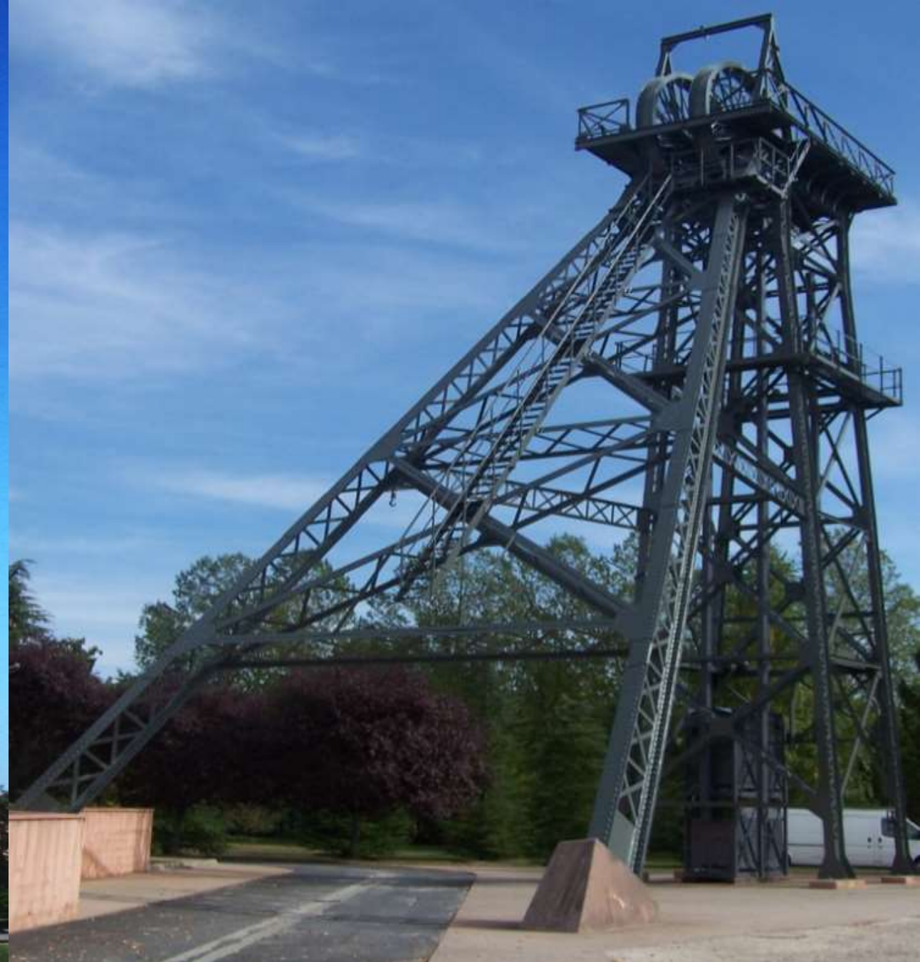
avant travaux – Souscription et Subvention : Chevalement de BLAYE LES MINES – après travaux