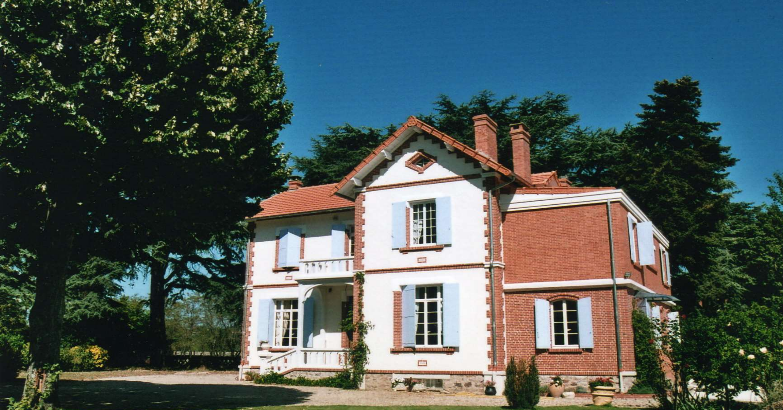
Label AIF - Maison à BLAYE LES MINES - après travaux