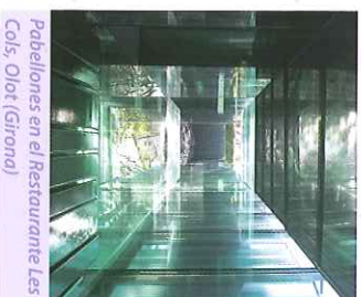
Pabellones en el Restaurante Les Cols, Olot (Girona)