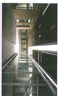
Groupe scolaire Nuyens à Bordeaux

La question constructive et le détail d'architecture.