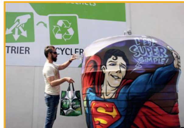
Conteneurs Grand Avignon