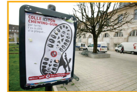
Panneaux chewing-gum Besançon