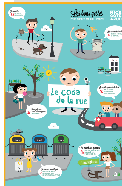
Code de la rue junior de la ville de Nice